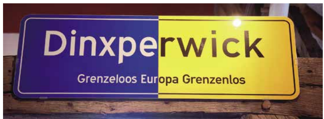
In Dinxperlo und Suderwick spielt die Grenze keine Rolle.