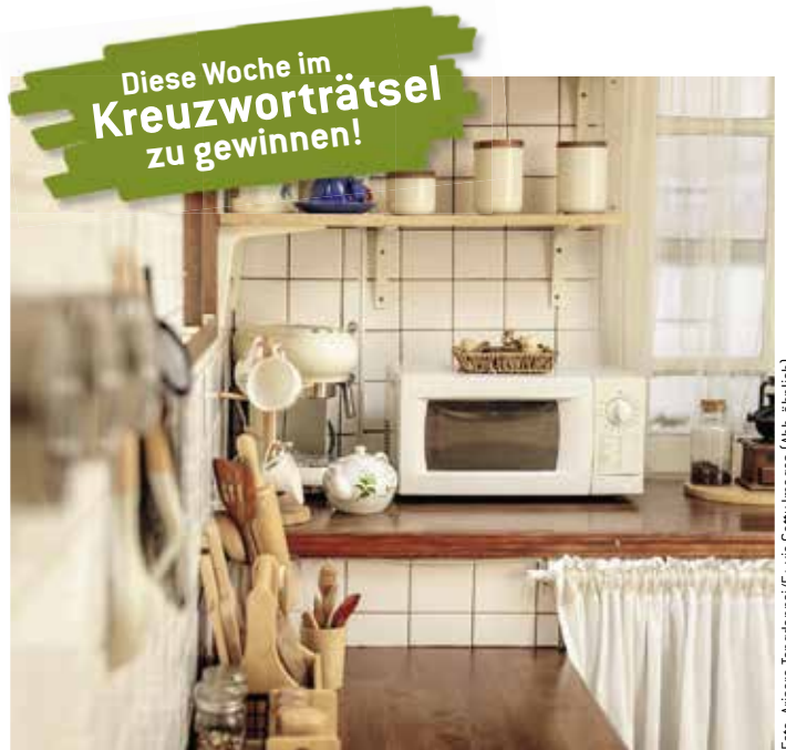
Die Cecotec Mikrowelle verbindet Retro-Look mit moderner Funktion.

Alles wird sich regeln lassen. Bleiben Sie realistisch, wenn manches nicht rundläuft, und gönnen Sie sich Auszeiten. Glückstag: Mittwoch