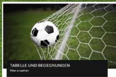
Diese Kachel wird angeklickt.

Smartphone und PC: Unter dem Feld für die Tipps gibt es die Kachel „Tabelle und Begegnungen“ Wer diese anklickt, landet bei „Tabellen“ und „Vorschau“ (dem erweiterten Wettprogramm).