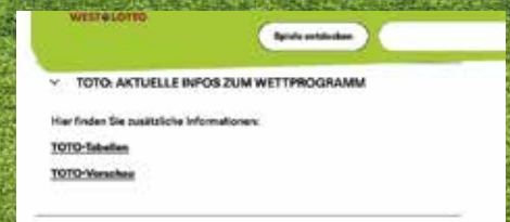
„Tabellen“ und „Vorschau“ sind online zu finden.

Sobald die Tipps fertig sind, müssen sie nicht in den Warenkorb gelegt werden. Wer „Im Shop spielen“ anklickt erhält ein PDF, das automatisch heruntergeladen wird. Dieses PDF ausdrucken und in der WestLotto-Annahmestelle vorlegen. Dort wird der Barcode eingeleistet und anschließend die Spielquittung ausgehändigt. Statt Papierausdruck kann der Barcode des PDFs auch per Smartphone vorgezeigt werden. In der WestLotto-Annahmestelle entfällt dieser Schritt.