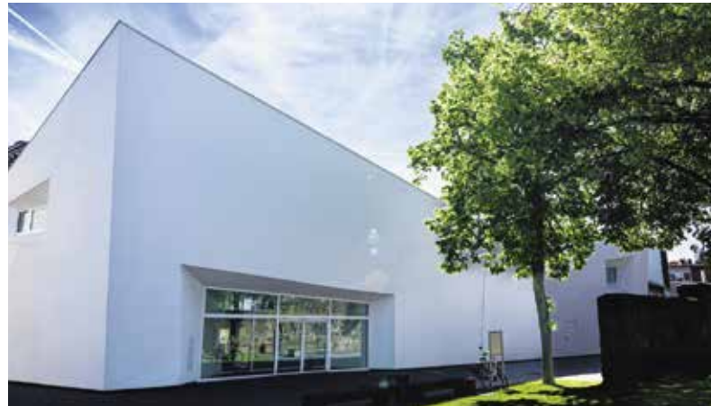
Das Papiermuseum Düren widmet sich einem alltäglichen und gleichzeitig faszinierenden Material.

Bereits von außen setzt das Gebäude in unmittelbarer Nachbarschaft zum Leopold-Hoesch-Museum ein architektonisches Statement: Die Architektur erinnert an ein gefaltetes Blatt Papier. Im Inneren zeichnet die Dauerausstellung den Weg von der Faser zum fertigen Papier nach. Die Ausstellung ist so konzipiert, dass Familien das Material selbst erleben und erproben können. Besucher lernen verschiedene Qualitäten, Produktionstechniken