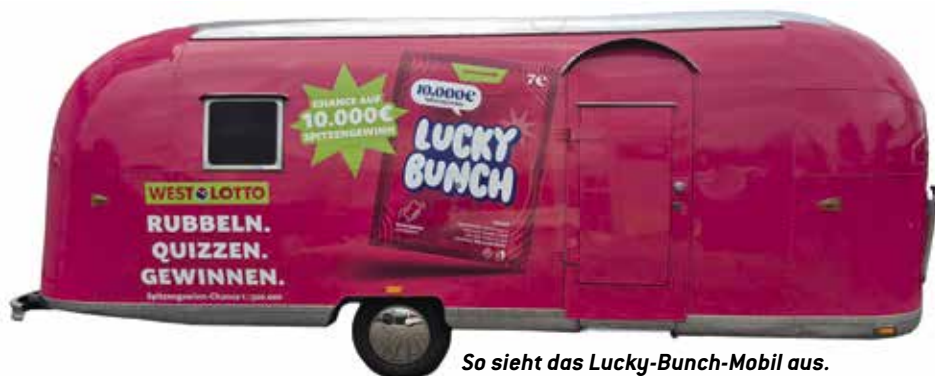
So sieht das Lucky-Bunch-Mobil aus.