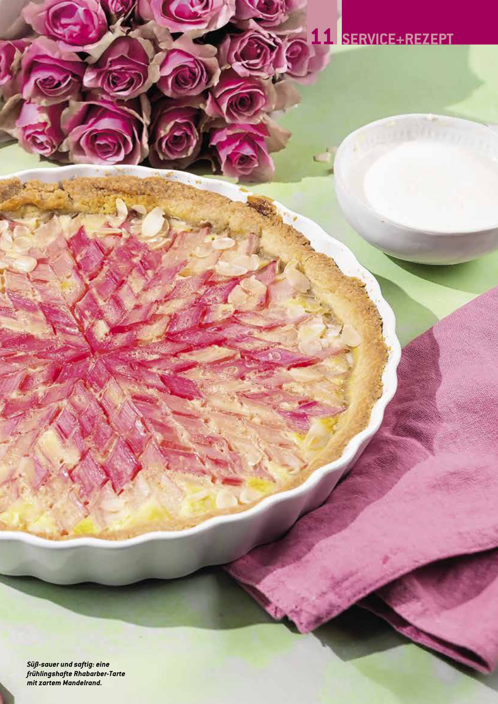
Süß-sauer und saftig: eine frühlingshafte Rhabarber-Tarte mit zartem Mandelrand.