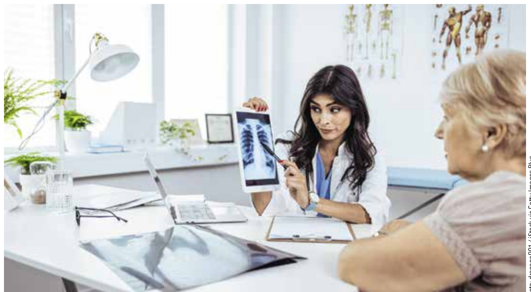
Früherkennung rettet Leben: Seit April können starke Raucherinnen und Raucher jährlich ein kostenloses Lungenkrebscreening in Anspruch nehmen.