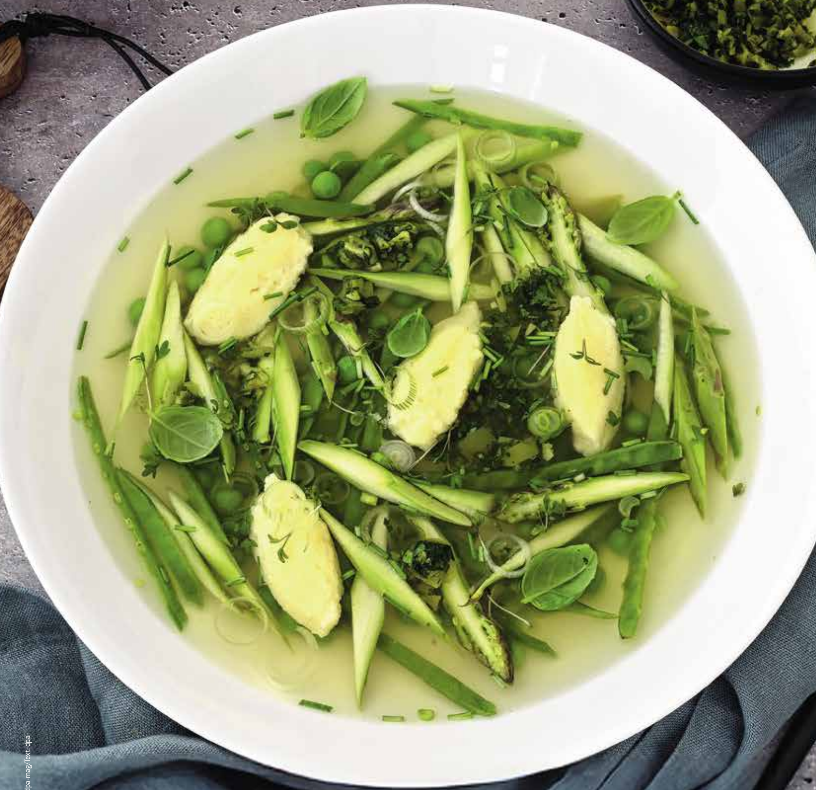
Diese Suppe mit Parmesan-Nocken sowie grünem Spargel und knackigen Kräutern bringt den Frühling in den Suppenteller.