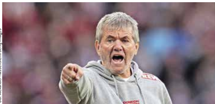
Friedhelm Funkel – hier am 9. Mai 2025 in der Partie Nürnberg - Köln – übernahm die Geißböcke zwei Spieltage vor Saisonende. Durch zwei Siege stiegen sie in die Bundesliga auf.